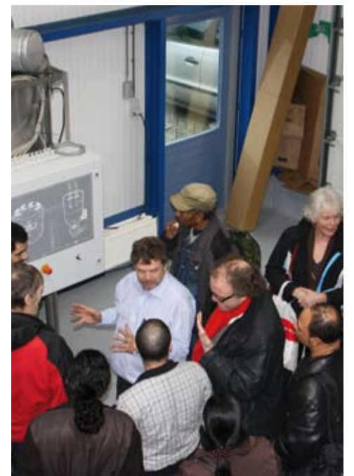
▶ Bewoners van de Koningvrouwen van Landlust tijdens het bezoek van een firma van verwarmingsketels.

Haard voor Bos en Lommer, Amsterdam en misschien wel heel Nederland, begeleid door Buurtparticipatie Bos en Lommer.