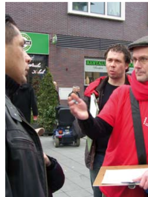
▶ Bewoner Pellencau (links) zegt, na het zetten van zijn handtekening: "Als jullie niet meer bij ons horen, blijven we jullie op straat wel gedag zeggen, hoor!"