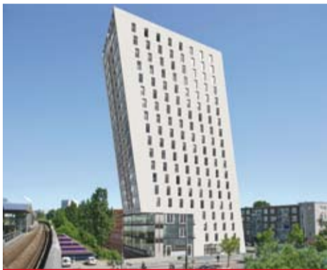
▶ De kredietcrisis heeft nog geen invloed op de bouw van de New Kit in de Kolenkitbuurt.