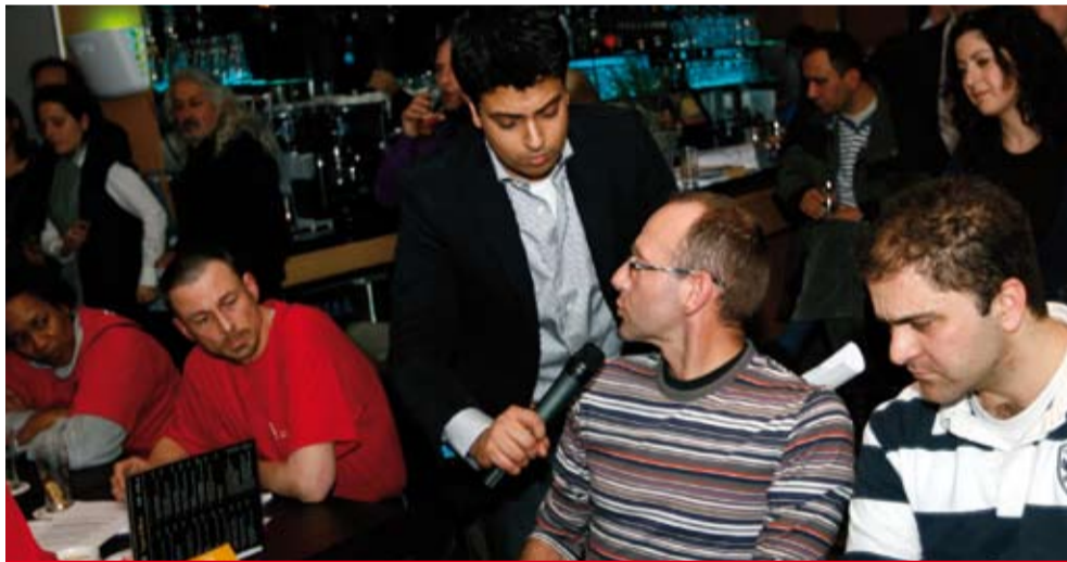
▶ Tijdens het Politiek Café op 27 februari werd er hevig gediscussieerd over de fusieplannen voor de stadsdelen.

bestuur meenemen. Woensdag 4 maart sprak een stadsdeelraadcommissie over het onderwerp. De meningen van de partijen liepen behoorlijk uiteen en aan het einde van de avond was geen consensus bereikt. De grootste partijen zijn voor behoud van de Kolenkitbuurt. Op 18 maart heeft de deelraad een motie voor behoud van de Kolenkit bij Bos en Lommer