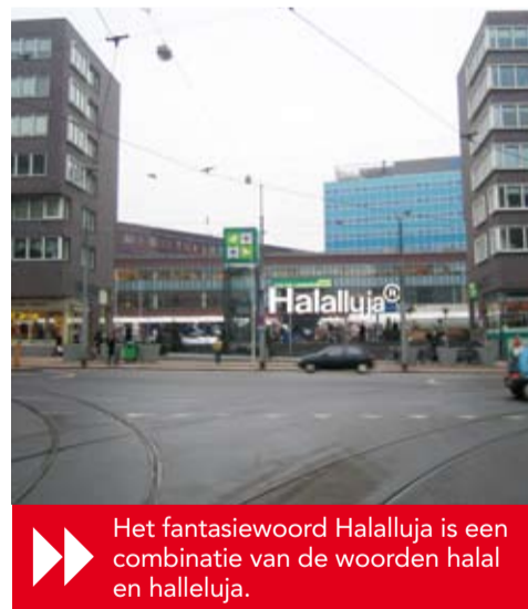
▶ Het fantasiewoord Halalluja is een combinatie van de woorden halal en halleluja.

Een van de opvallendste kunstwerken is het fantasiewoord Halalluja dat met