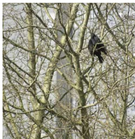
▶ De taludkraaien hier op de foto. Beide stadsdelen, Westpoort-Teleport en Bos en Lommer kunnen zorgen voor extra "tijdelijke" natuur om de talloze verjaagde dieren huisvesting en voedsel te bieden tot ze weer terug kunnen naar de taluds.