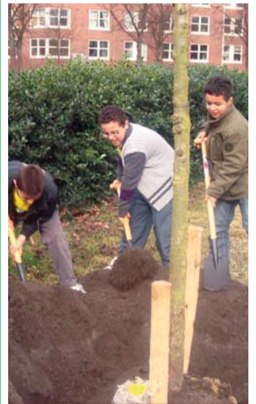
▶ Kinderen van de El Amien basisschool planten iepen op het plantsoen bij de Rustende Tuinder op de nationale Boomfeestdag.

Openingstijden van Het Digitale Bos: vrijdag 24 april van 19.00 – 21.00 uur en zaterdag 25 april van 10.00 – 17.00 uur