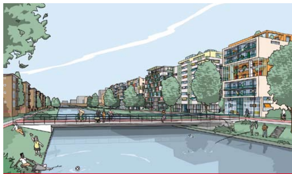
▶ Een impressie van het wonen langs de Erasmusgracht.

Tussen de A-10, het Ringspoor, de Erasmusgracht en de Jan van Galenstraat komt een nieuwe wijk: Laan van Spartaan. Wat gebeurt daar allemaal?