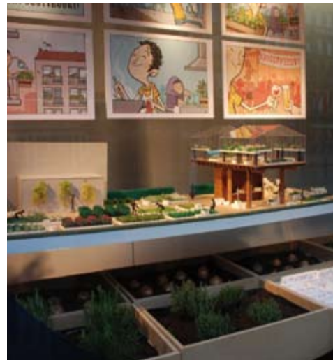
▶ Het winnend ontwerp van kunstenaars collectief stichting OE.

Meer informatie vind je op hun website: www.youmeetoe.org