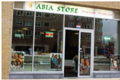
▶ De Tropische winkel Abia Store aan de Hoofdweg.

5 eetlepels kouseband (roerbakmix) toevoegen en enkele minuten doorbakken. Maak de zuurkool los met een vork. Schil de aardappelen en snijdt ze in stukken. Schenk ruim water in een pan, voeg de aardappelen en een ½ theelepel zout toe. Leg de zuurkool op de aardappelen. Breng het aan de kook. Draai het vuur laag en kook de groente op een laag vuur tot ze gaar zijn (ca. 25 minuten). Giet de groente af en vang het kookvocht op in een kom. Stamp de aardappelen en de zuurkool door elkaar. Roer de boter erdoor en maak de stampot zo nodig wat smeugiger met een scheutje kookvocht of een scheutje uitgebakken vet van de Masterbeef. Roer de Masterbeef door de stampot. Serveer het op een mooi bord en uw stampot is klaar.