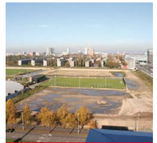
▶ Laan van Spartaan voor de bouw.

De bouw van de Tribune kunt u live volgen via een webcam. Met elk kwartier een update en een album met van elke dag een foto. Om het album te bekijken: http://www.laanvanspartaan.nl/webcam/ Meer informatie en om u in te schrijven als belangstellende: www.laanvanspartaan.nl